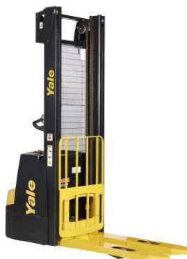
serie noua AC STOC

CATARGELE SUNT DUPLEX DOI CLINDRI WIDE VIEW SERIA PROFESIONALA HEAVY-DUTY